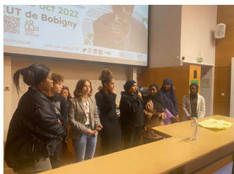
Images du Campus Ciné Festival 2022